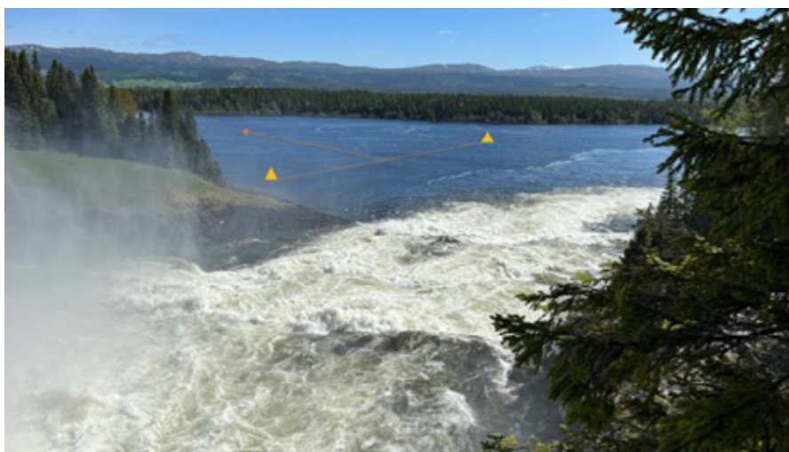
Starten vid Tännforsen